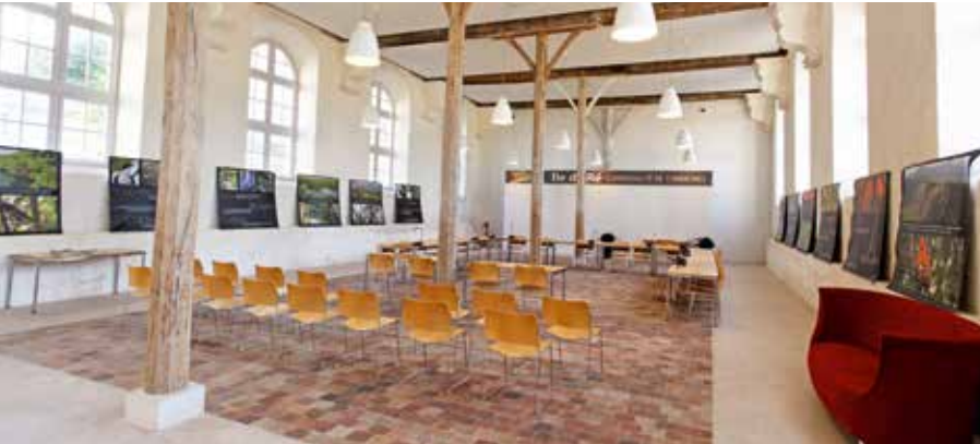
En haut, la salle des hommes de l'ancien hôpital, vers 1925 En bas, la salle des hommes restaurée en 2008, aujourd'hui salle du Conseil Communautaire

Première île labellisée, l'île de Ré appartient au réseau national des villes et pays d'art et d'histoire depuis le 26 juillet 2012.