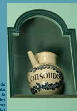
Chevrette de consoude, plante permettant la consolidation des fractures (XVIII e siècle)

Edifiée dans la première moitié du XVIII e siècle , l'aile Saint-Louis constituait le bâtiment central et l'entrée principale de l'hôpital. Cette partie de l'établissement renferme deux joyaux du patrimoine martinais : une apothicairerie du XVIII e siècle et un décor lambrissé de 1817, tous deux classés au titre des Monuments Historiques en 1925. Le lambris en noyer occupe un ancien parloir, devenu ensuite le bureau du directeur de l'hôpital.