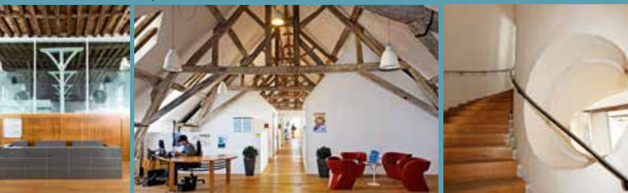
L'aile Saint-Michel aujourd'hui, accueil de la Communauté de Communes, bureaux du 4 e niveau et escaliers