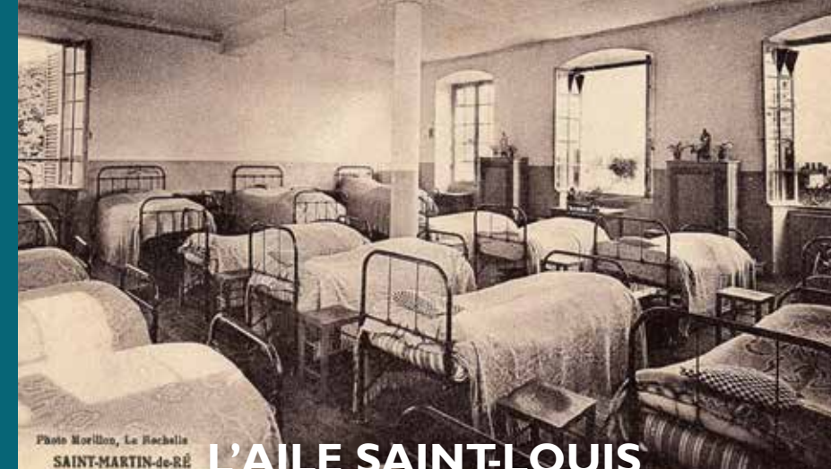
Le Rochelleis SAINT-MARTIN-DE-RÉ