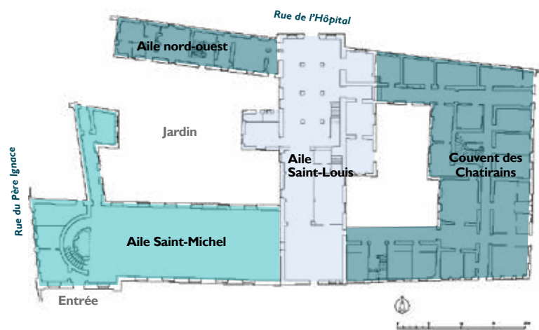
Plan général de l'ancien hôpital au XVIII e siècle et usages actuels

Les ailes Saint-Michel et Saint-Louis sont chaque année ouvertes au public dans le cadre des Journées européennes du patrimoine.