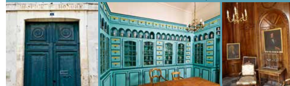
L'aile Saint-Louis aujourd'hui, apothicairerie et ancien bureau du directeur de l'hôpital

L'aile Saint-Louis est aujourd'hui propriété de la commune de Saint-Martin-de-Ré.