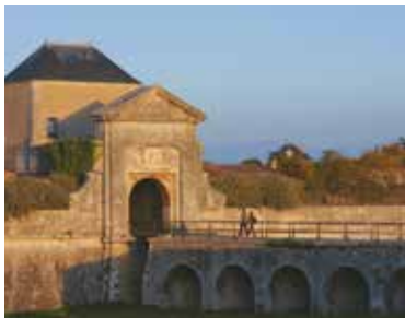
Visite guidée Les remparts de Saint-Martin-de-Ré

30 mai à 18h VISITE GUIDÉE « LES REMPARTS DE SAINT-MARTIN-DE-RÉ »