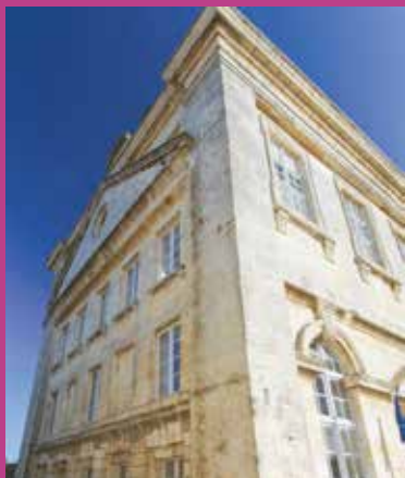
Hôpital Saint-Honoré Saint-Martin-de-Ré