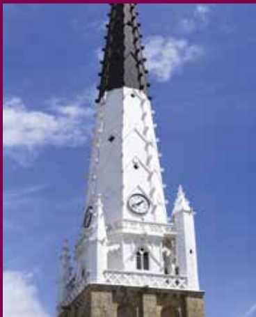
Clocher de l'église d'Ars Ars-en-ré