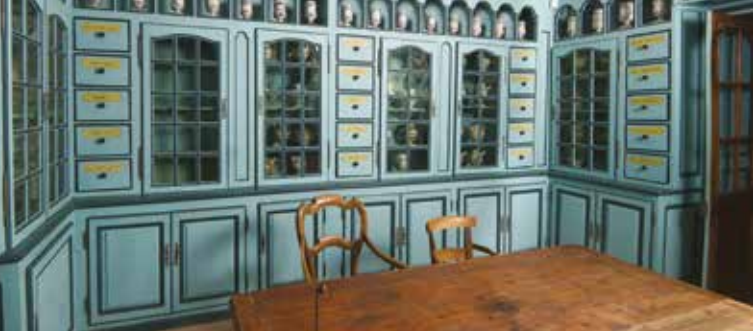
Visite flash Apothicaierie