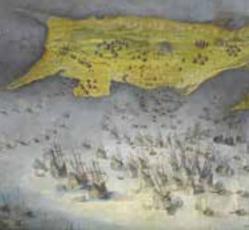
Siège de l'île de Ré de 1625 (détail) peinture d'après une gravure de Jacques Callot, vers 1640. Château de Versailles