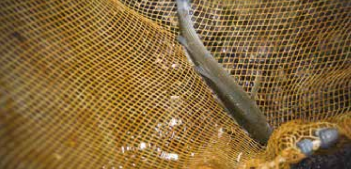
Visite guidée Écluse à poisson