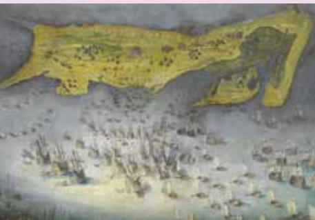
Siège de l'île de Ré de 1625 (détail) peinture d'après une gravure de Jacques Callot, vers 1640. Château de Versailles

Programme détaillé à venir – consultable sur le site de la Communauté de communes de l'île de Ré à l'adresse suivante : www.cdiledere.fr