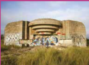
Visite guidée Blockhaus de la conche des Baleines

Le service Patrimoine et le service Culture s'associent pour vous proposer des cinés balades. Avant la projection proposée à La Maline, découvrez les lieux de tournage et toute l'histoire de l'île pendant la Seconde Guerre mondiale.