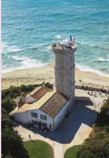
La vieille tour Saint-Clément-des-Baleines

▷ Devant la grille du site, phare des Baleines, Saint-Clément-des-Baleines