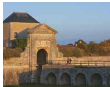
Visite guidée Les remparts de Saint-Martin-de-Ré

30 mai à 18h VISITE GUIDÉE « LES REMPARTS DE SAINT-MARTIN-DE-RÉ »