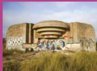
Visite guidée Blockhaus de la conche des Baleines

Le service Patrimoine et le service Culture s'associent pour vous proposer des cinés balades. Avant la projection proposée à La Maline, découvrez les lieux de tournage et toute l'histoire de l'île pendant la Seconde Guerre mondiale.