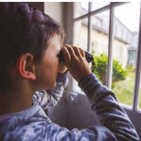
Secoue ton patrimoine