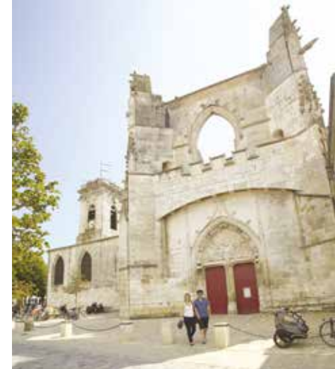
Église de Saint-Martin-de-Ré

▷ Place de la mairie, Sainte-Marie-de-Ré