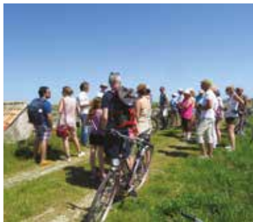
Balade à vélo Marais salants