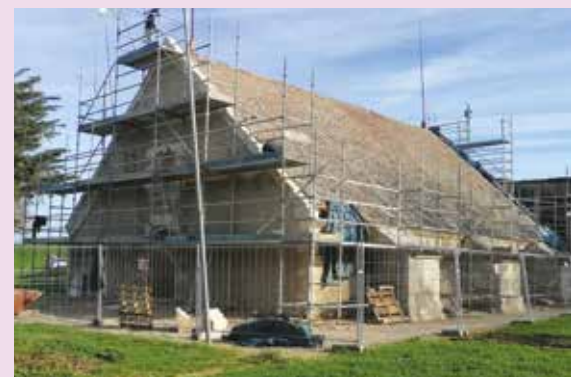
Visite de chantier La poudrière du bastion Saint-Louis