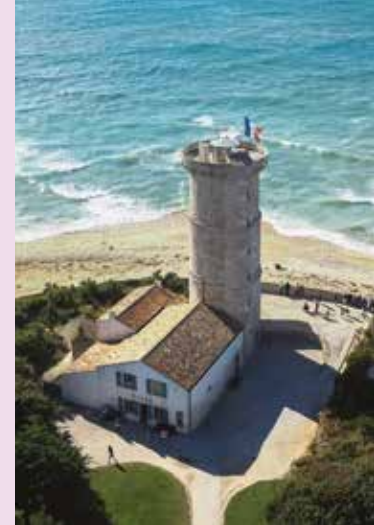
La vieille tour Saint-Clément-des-Baleines

21 juin à 15h00 VISITE GUIDÉE « LA POINTE DES BALEINES »