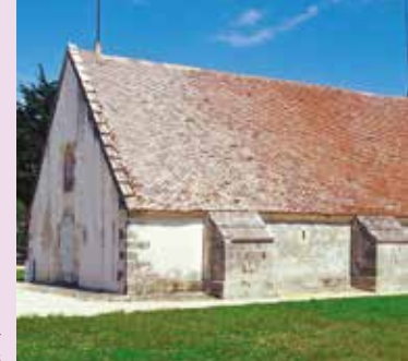
Visite de chantier La poudrière du bastion Saint-Louis

La poudrière du bastion Saint-Louis fait actuellement l'objet d'une restauration avec le soutien de la Fondation du patrimoine. Profitez de visites flash pour découvrir de plus près le chantier de restauration.