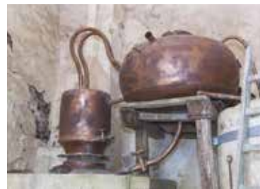
Visite flash L'Alambic de Sainte-Marie-de-Ré

▷ Office de tourisme, sur le port, La Flotte