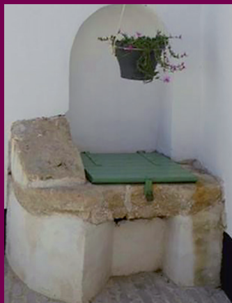
Puits de la ruelle des Mitrons avant/après restauration