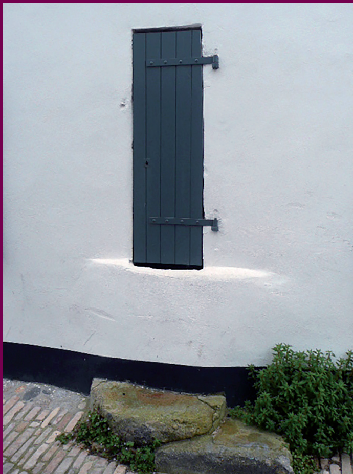
Puits de la ruelle des Prés