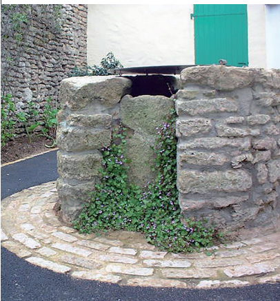
Puits de l'impasse du bout du Monde