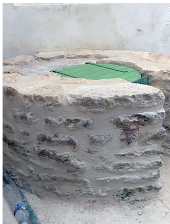
Puits de l'impasse des Baladins