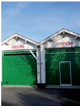
Les anciens hangars à locomotives