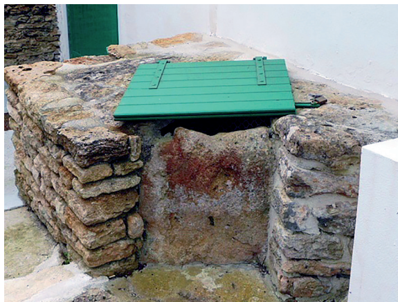
Puits de la ruelle des Rentiers