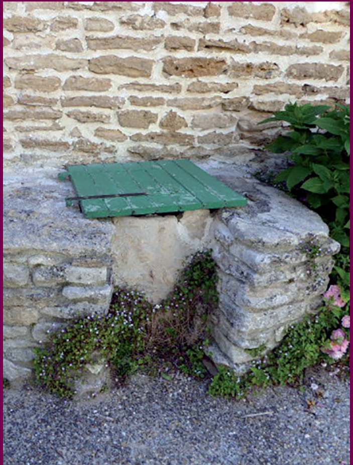
Puits de l'impasse de la Gondole