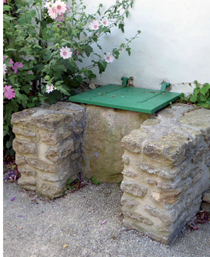
Puits de l'impasse des Fleurs