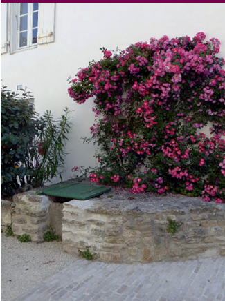
Puits de la place des Figuiers