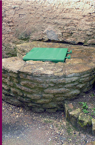
Puits de l'impasse du Gorge-Bleue