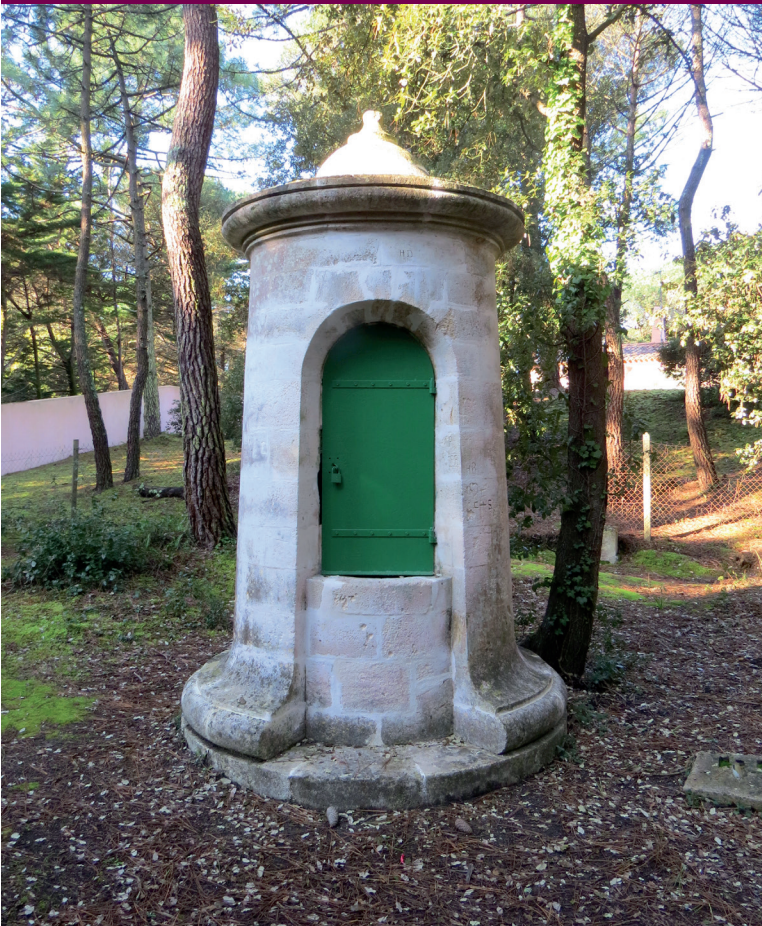
Puits de Trousse-Chemise