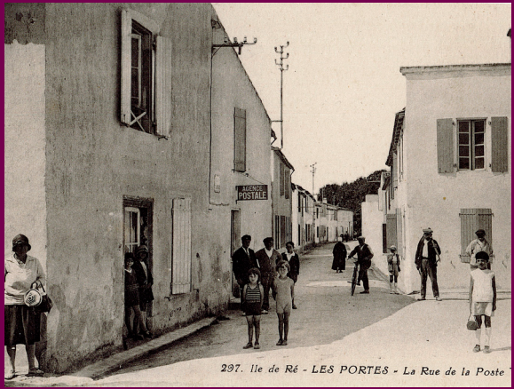
Place devant la Poste