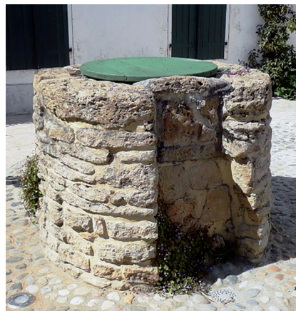
Puits de la place de la Liberté