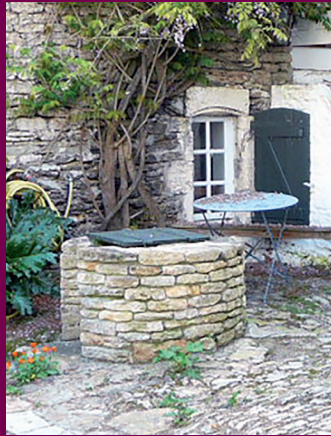
Puits de la ruelle de l'Aquarelle