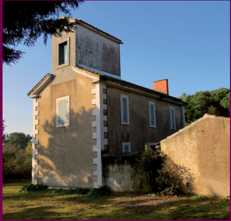
Phare de Trousse-Chemise