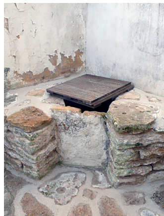
Puits de l'impasse Tiphanaud