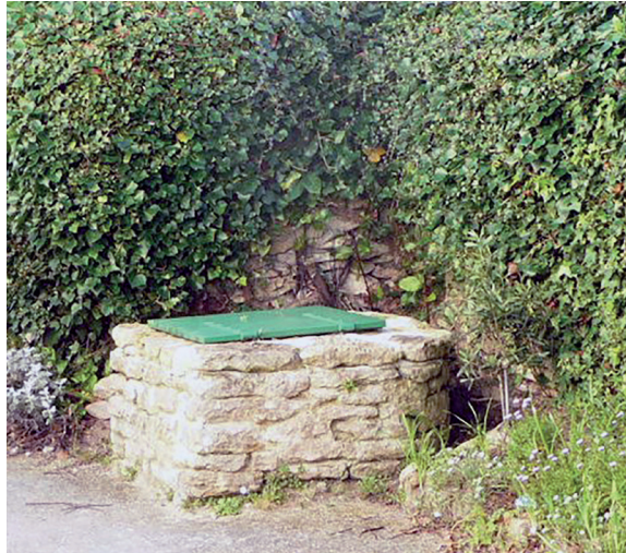
Puits de l'impasse du Rossignol