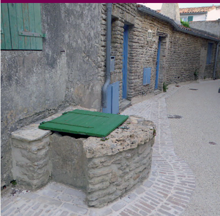
Puits de l'impasse des Jardins