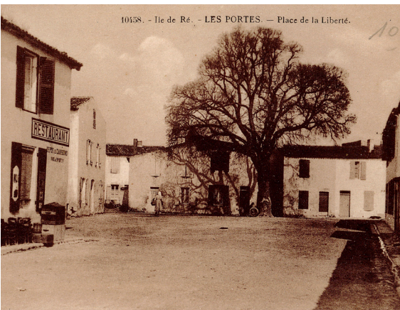
Place de la Liberté