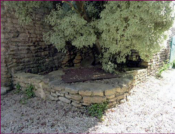
Puits de l'impasse du Moulin