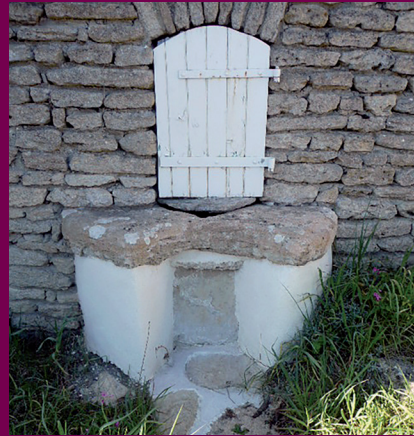
Puits de la rue principale de La Rivière