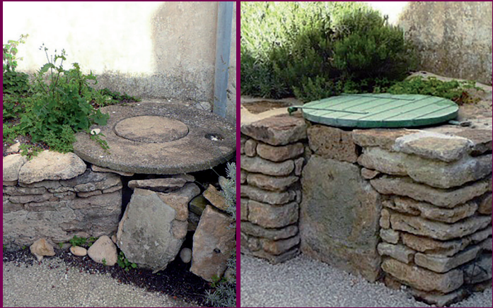
Puits de l'impasse de la Dordogne avant/après restauration