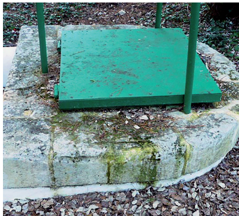
Puits du Feu du Fier avant/après restauration