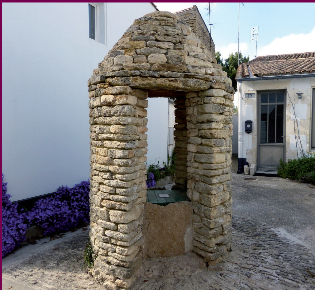
Puits de la place Tourette