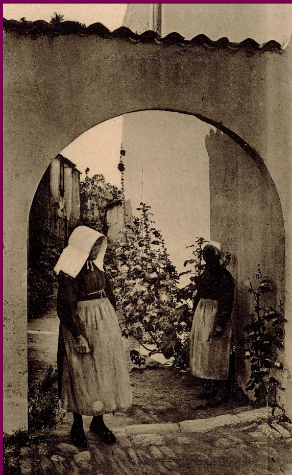
Porche de l'impasse du Gorge-Bleue