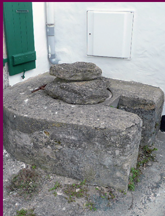
Puits de la ruelle des Bergeronettes