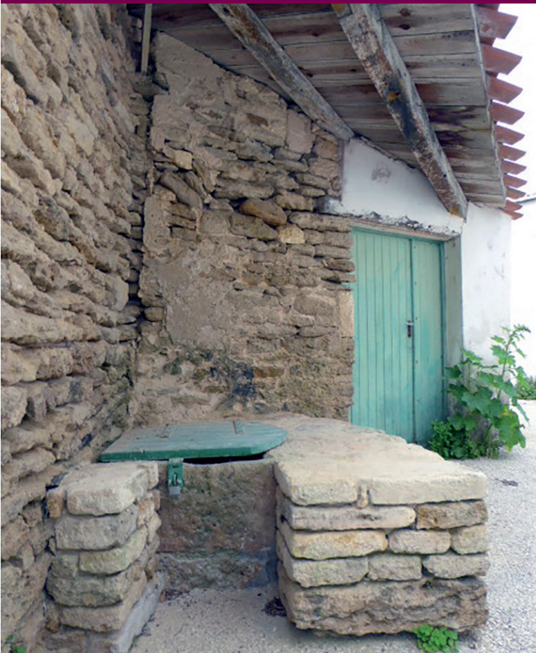
Puits de l'impasse des Roses