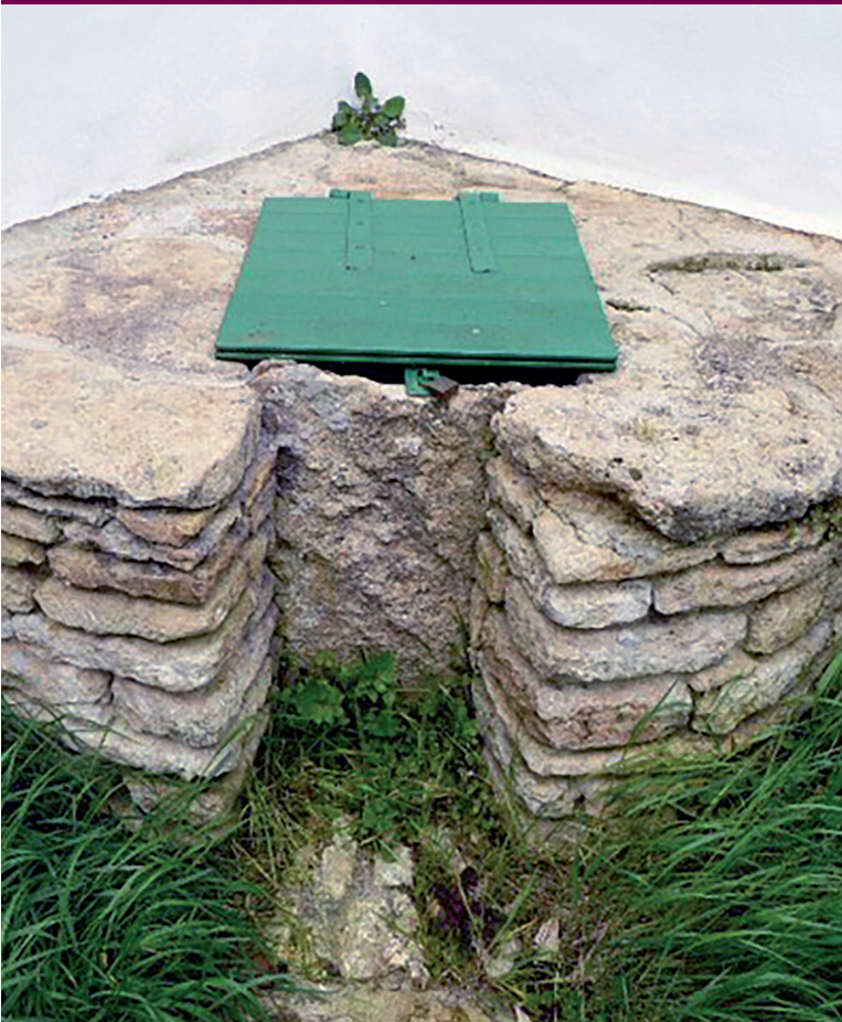
Puits de l'impasse du Rêve