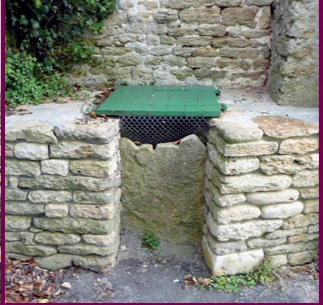
Les deux puits de la ruelle des Saltimbanques