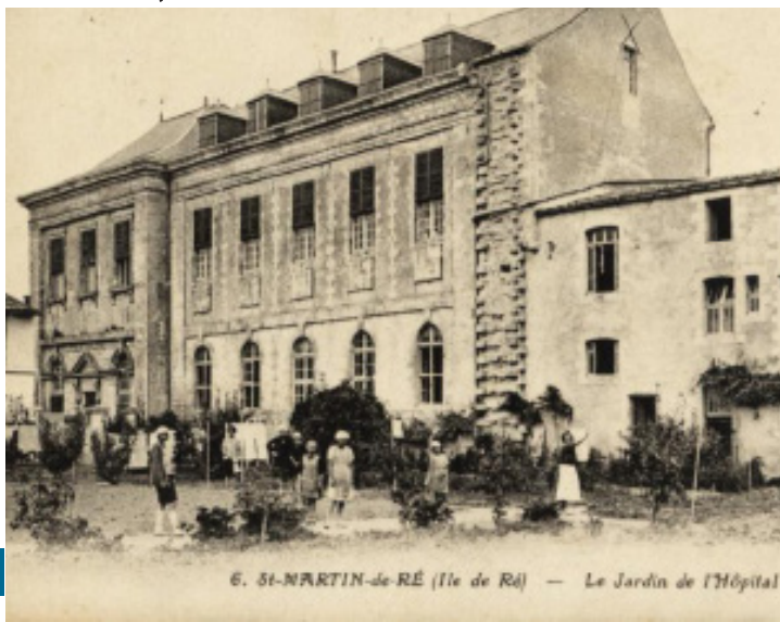
6. St-MARTIN-de RÉ (île de Ré) — Le Jardin de l'Hôpital