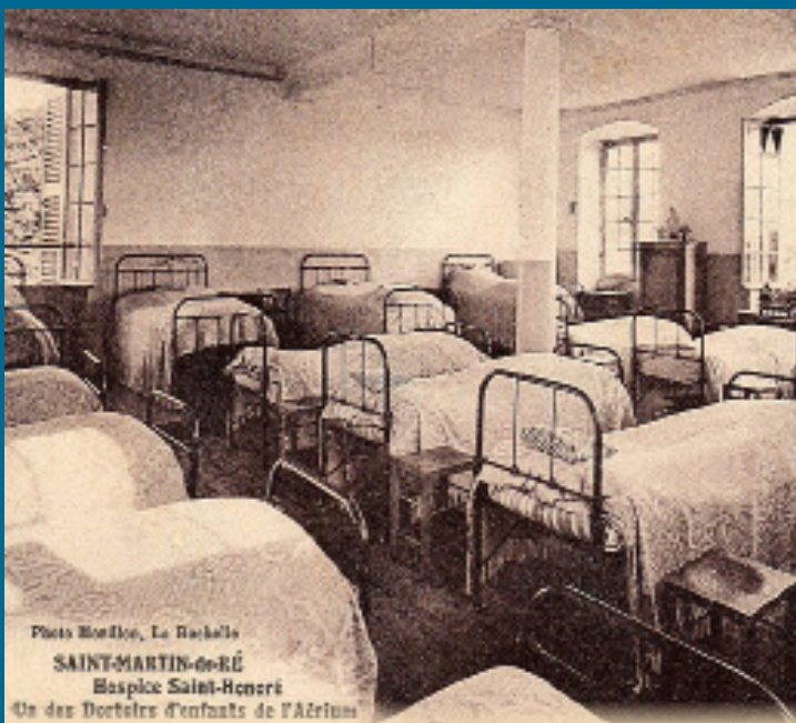
SAINT-MARTIN-de-RÉ Hospice Saint-Honoré Un des Dortoirs d'enfants de l'Aérium