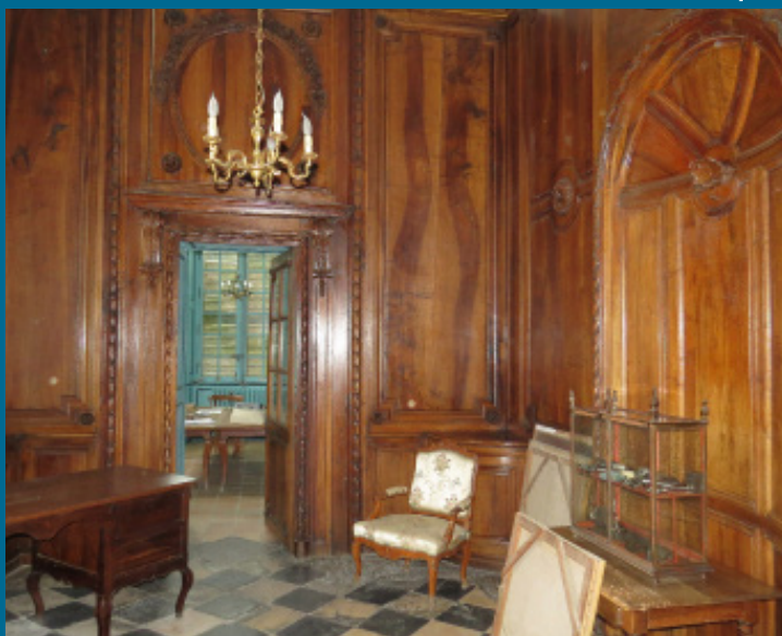
Ancien bureau du Directeur de l'hôpital