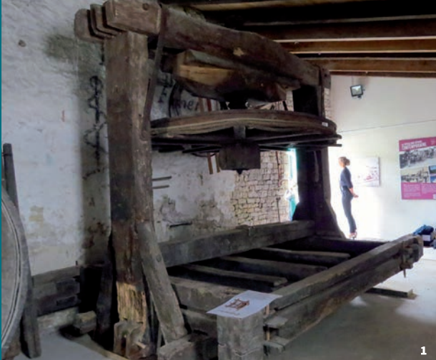
1. Pressoir à cabestan, Sainte-Marie-de-Ré