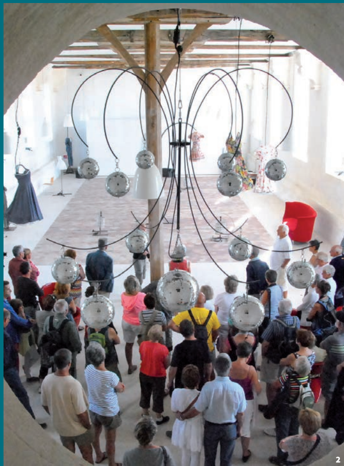
2. Ancien hôpital Saint-Honoré, Saint-Martin-de-Ré