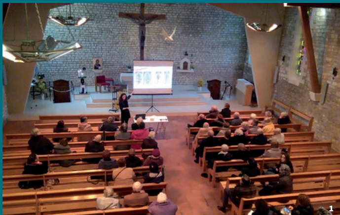
1. Église Notre-Dame-de-Lourdes, Rivedoux-Plage