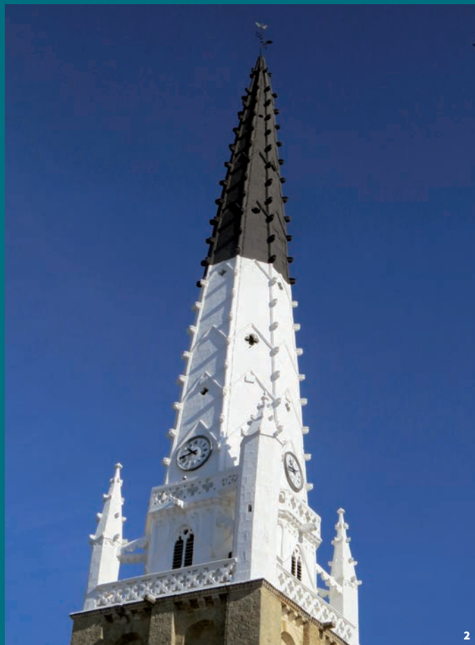
2. Clocher de l'église Saint-Étienne Ars-en-Ré