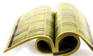
Les catalogues et annuaires