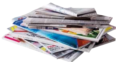
Les journaux et magazines