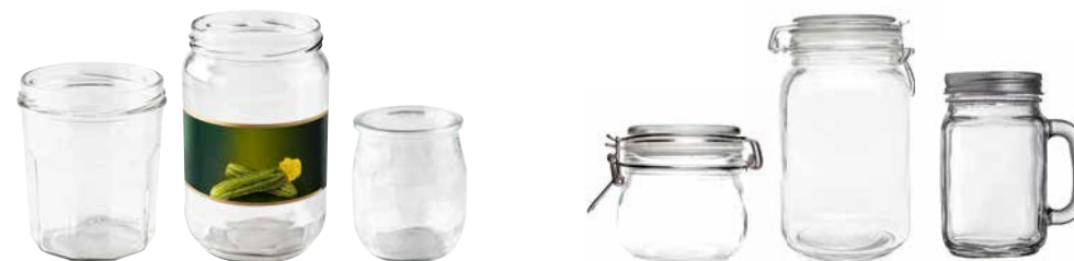
Les pots en verre