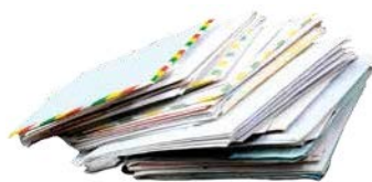
Les enveloppes avec ou sans fenêtres