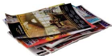
Les publicités et prospectus