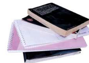
Les livres de poche, carnets, cahiers...