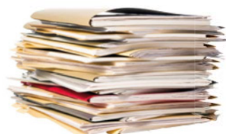
Les courriers et papiers de bureau