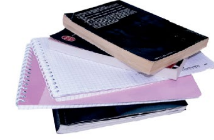
Les livres de poche, carnets, cahiers... (spiraales acceptées)