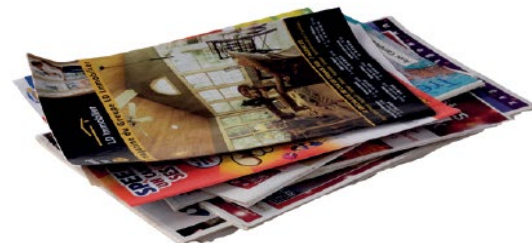
Les publicités et prospectus

Pour répondre à la demande d'établissements produisant une grande quantité de papier, la Communauté de Communes met en place un service gratuit de collecte en porte à porte. Celle-ci se fera une fois par mois. La sortie du bac spécifique à la collecte du papier est sous votre responsabilité.