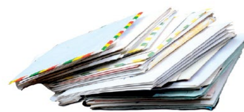
Les enveloppes avec ou sans fenêtre