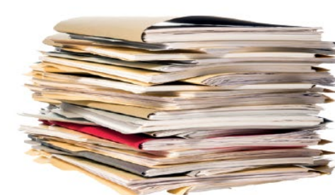
Les courriers et papiers de bureau