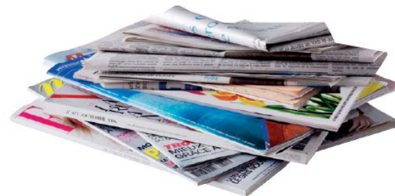
Les journaux et magazines